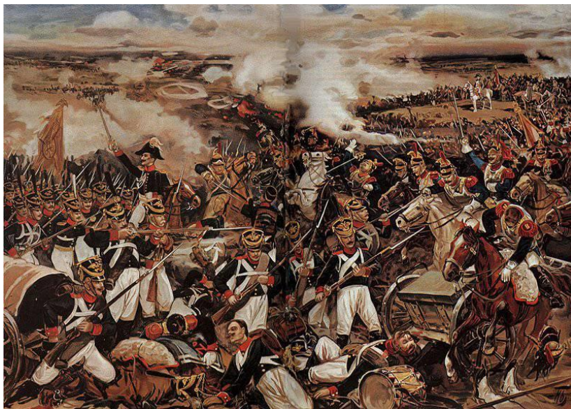
Эпизодъ Бородинскаго сраженія. Иллюстрація къ стихотворенію М. Ю. Лермонтова «Бородино». Хромолитографія Н. Богатова. 1912 г.

Да, были люди въ наше время. Могучее, лихое племя: Богатыри не вы! Плохая имъ доедалась доля: Немногіе вернулись съ поля... Когда бъ на то не Божья воля, Не отдали бъ Москвы!